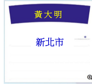
例 4.姓名貼遮/教練不罰