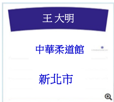
例 5.道館名貼遮/教練不罰