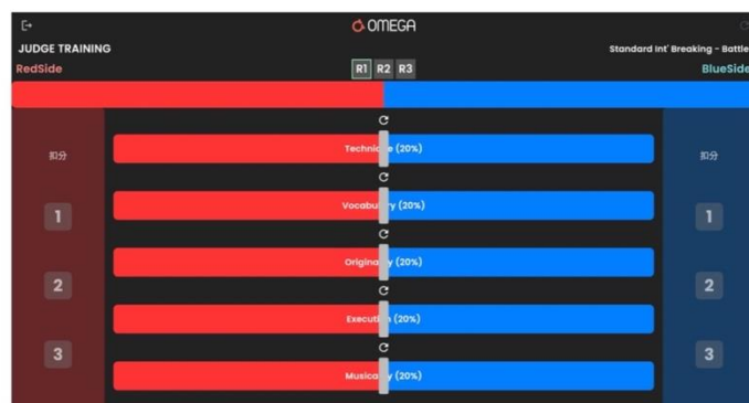
表 4. 霹靂舞裁判系統