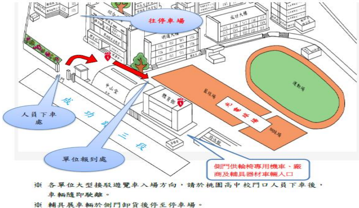
桃園市 115 年身心障礙運動嘉年華交通動線指引圖